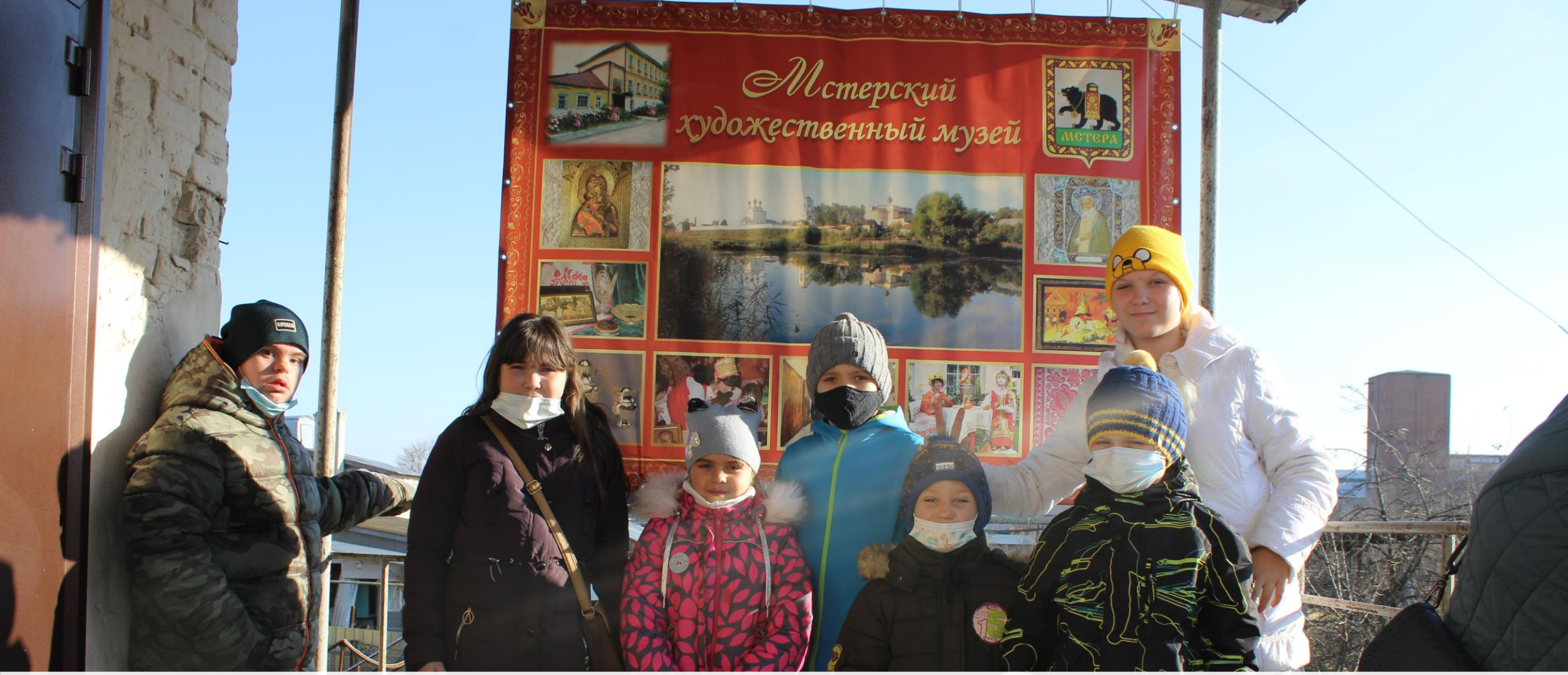
семейный клуб выходного дня (семьи с детьми инвалидами) посетил «Мстерский художественный музей».